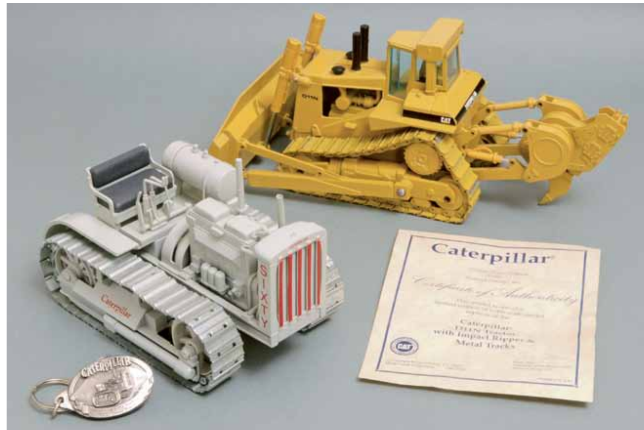
Caterpillar Sixty in 1:25 von Conrad und D11N mit Impact Ripper in 1:50 von Norscot (Conrad) – mit Zertifikat.

Erworben werden die neuen Modelle heute oft direkt in den USA. Der Sammler hat damit bisher gute Erfahrungen gemacht. Aus den Programmen verschwundene Modelle sucht er auf Ebay und Ricardo.ch, einer Internetbörse in der Schweiz. Etwa 500 Modelle von Caterpillar in allen gängigen Maßstäben von 1:87 bis 1:16 werden mittlerweile in Vitrinen präsentiert und verschiedene weitere Gegenstände – beispielsweise ein Stein vom Cat-Testgelände in Malaga – ergänzen die Sammlung. Zu den seltenen Modellen zählen ein Sixty in 1:25 und eine Cat Raupe D11N mit Impact Ripper in 1:50, beide vom deutschen Hersteller Conrad und mit Zertifikat. Momentan freut er sich schon sehr auf die D9H von CCM, die in drei Versionen erscheinen wird. Bei aller Liebe zu den Cat Modellen: Einer Sammelleidenschaft ist Christian Winkler alias Ben Austria unabhängig davon treu geblieben. Neben den Modellbaumaschinen sammelt er auch Whiskey-Flaschen von Jack Daniels, die natürlich nur ungeöffnet ihren Wert erhalten.