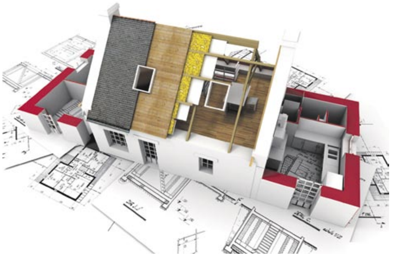
So lässt sich der Bauablauf simulieren. Die Elemente des 3D-Modells sind mit den Vorgängen aus dem Bauablaufplan verknüpft.

Das System ermöglicht eine fundierte Bedarfsplanung anhand von anschaulichen und realitätsnahen Modellen und sichert eine präzise und kundenorientierte Abstimmung mit dem Bauherrn zum Baubudget und Fertigstellungstermin. Leistungsänderungen werden auf diese Weise minimiert, ein reibungsloser Bauablauf und damit auch eine hohe Kundenzufriedenheit sichergestellt.