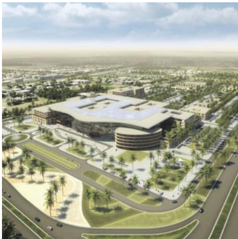
Geplant wird das Oasenkrankenhaus, das bis 2013 fertig gestellt werden soll, mitten in der Wüste von Obermeyer und seiner auf Krankenhausplanung spezialisierten Tochtergesellschaft Faust Consult.

den. Das Reha-Zentrum mit seinen 150 Betten ist eine Neuheit in den Vereinigten Arabischen Emiraten. Der ganze Komplex wird durch drei Wirtschaftsgebäude abgeschlossen. Hier befinden sich die technische und logistische Ver- und Entsorgung. Um Patienten nicht durch Lieferverkehr und Lärm zu stören, wurden alle Gebäude durch ein unterirdisches Tunnelsystem miteinander verbunden, in welchem Elektroautos den Warenverkehr zwischen allen Bereichen des Campuses übernehmen.