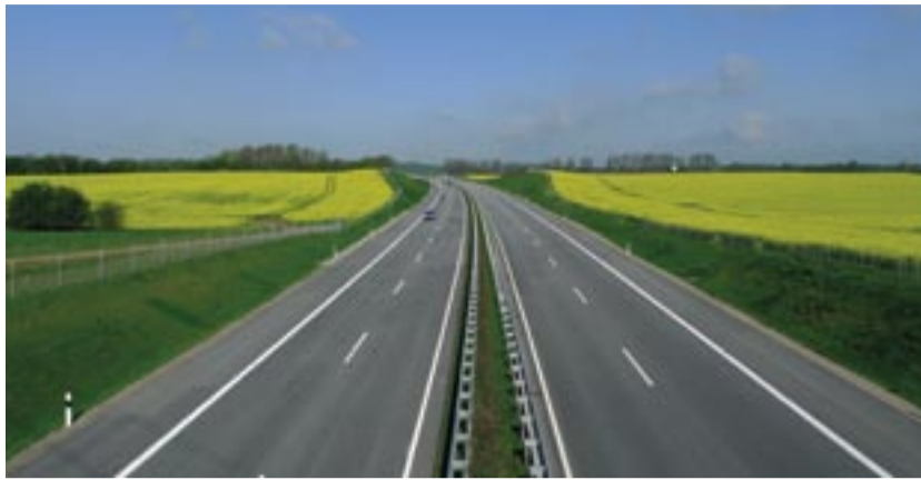
Werden deutsche Tugenden im Ausland gerühmt, dann wird in der Regel der Bau von Autobahnen genannt.

Ihre erste Chance für die Umsetzung eines Projekts nutzten die Autobahnbefürworter im Rheinland. Vahrenkamp kam bei Durchsicht der Archive zu dem Ergebnis, dass der verlorene Erste Weltkrieg den Lobbyisten dort in die Hände spielte: In diesem Ballungsraum habe damals der gewerbliche Verkehr schnell zugenommen, während gleichzeitig die Eisenbahn als wichtigstes Transportmittel wegen der Besetzung des Rheinlands und Beschlagnahmeaktionen durch Franzosen und Belgier teilweise aus-