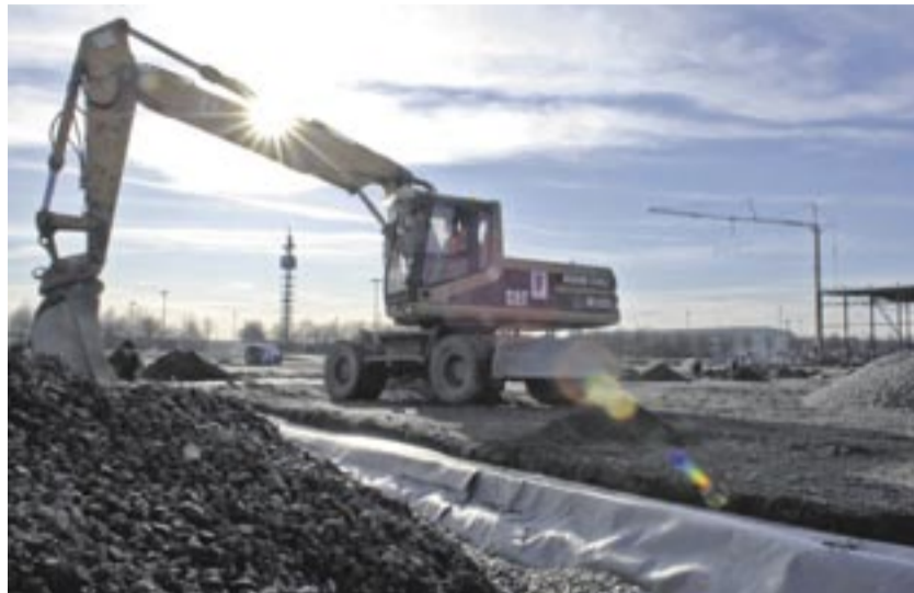
Die Vorbereitungen und Aufbauarbeiten zur bauma laufen bereits auf Hochtouren.

Ein Schwerpunktthema bei den zu erwartenden Neuerungen werden diesmal spartenübergreifende Lösungsansätze zur Emissionsreduktion sein. Die internationale Fachmesse für Baumaschinen, Baustoffmaschinen, Bergbaumaschinen, Baufahrzeuge und Baugeräte findet wenige Monate vor Inkrafttreten neuer Abgasrichtlinien statt: Ab dem Jahr 2011 gelten mit der Stufe IIIB der Richtlinie 97/68/EG und der US-Abgasgesetzgebung Tier 4 interim neue Grenzwerte für die Emissionen von Non-Road-Fahrzeugen, wie Baggern, Straßenwalzen und Fräsen. So sollen zum Beispiel die Partikelgrenzwerte im Vergleich zur heutigen Stufe III A bis zu 94 Prozent gesenkt werden. „Die Abgasbestimmungen der Stufen III B und IV sind eine Herausforderung sowohl für Motorenhersteller als auch für Maschinenhersteller, da in diesen Abgasstufen nicht nur der Motor allein, sondern auch verschiedene Komponenten zur Abgasnachbehandlung und deren Einbaubedingungen eine erhebliche Rolle zur Einhaltung der Grenzwerte