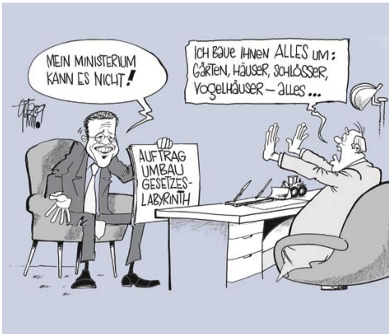
Aber an Gesetze und Vorgaben traue ich mich nicht heran!