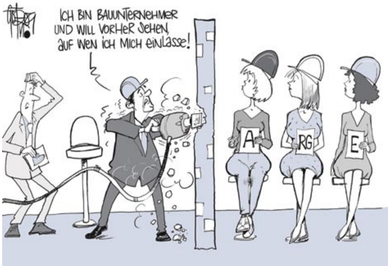
ARGE-Herzblatt: Finde deinen Traumpartner.

Bei der Echterhoff Bau Gruppe kümmert sich eine eigene Abteilung, getrennt von der übrigen Buchhaltung, um alle ARGEN, an denen das Unternehmen beteiligt ist. „ARGEN bedürfen unbedingt einer internen Organisation, denn die Abwicklung, Maschinen, das Material und Personal müssen koordiniert werden, sonst erleidet man Schiffbruch. Bei uns hat es sich bewährt, dass alle Leistungen an die ARGE durch die eigene ARGE-Abteilung fakturiert werden. Allerdings werden in den Bereichen Einkauf, Geräte- und Materialdisposition für die ARGE kein eigener Bereich vorgehalten“, so Koßmann. Ein großes Problem sei allein schon die Papierflut. Um die Abwicklung und Organisation in Zukunft zu erleichtern, hat sich das Unternehmen Unterstützung in Form einer Software ins Haus geholt, die in Zusammenarbeit mit dem BRZ nach den Vorgaben der Echterhoff Bau Gruppe entwickelt und von Christian Jurasin vom BRZ auf der Tagung mit den Worten vorgestellt wurde: „Mit der Software lässt sich die ARGE-Buchhaltung vielfältig auswerten. Abrechnung