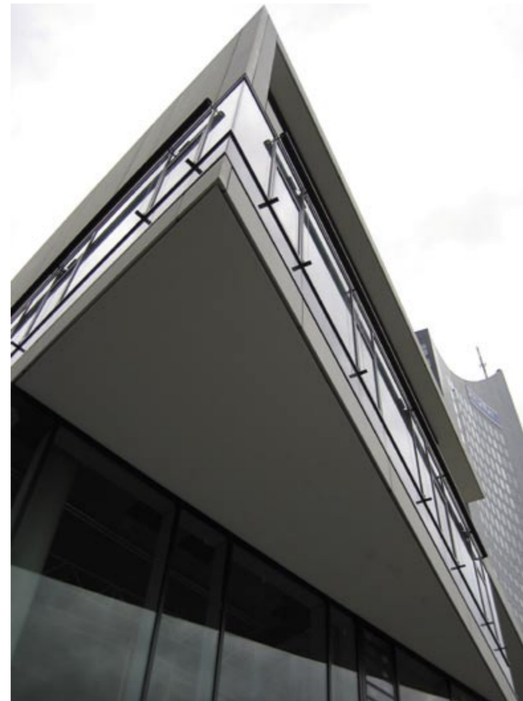
Detail Fassade Neubau Mensa.