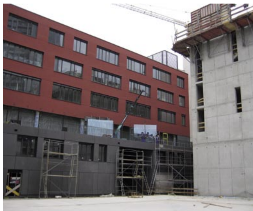
Neubau Institutsgebäude Wirtschaftswissenschaften von Süden/Innenhof.