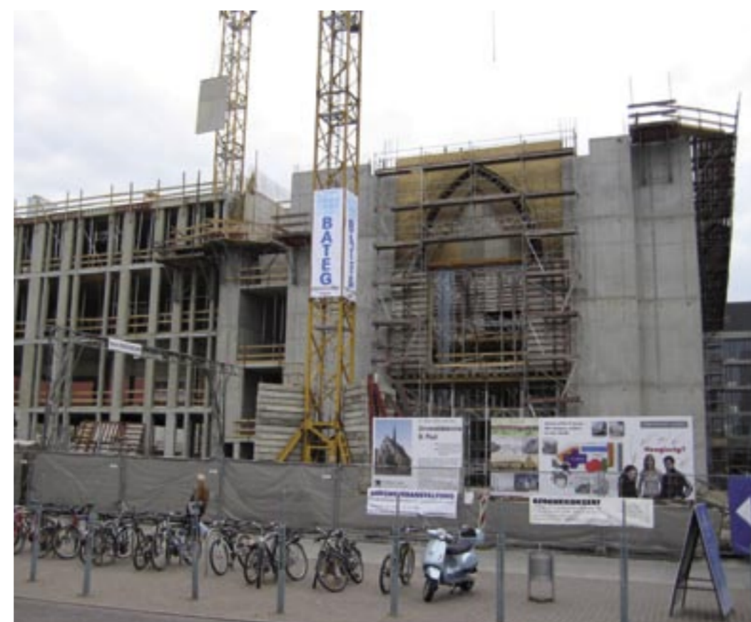
Neubau Aula/Kirchengebäude und Hauptgebäude von Osten.