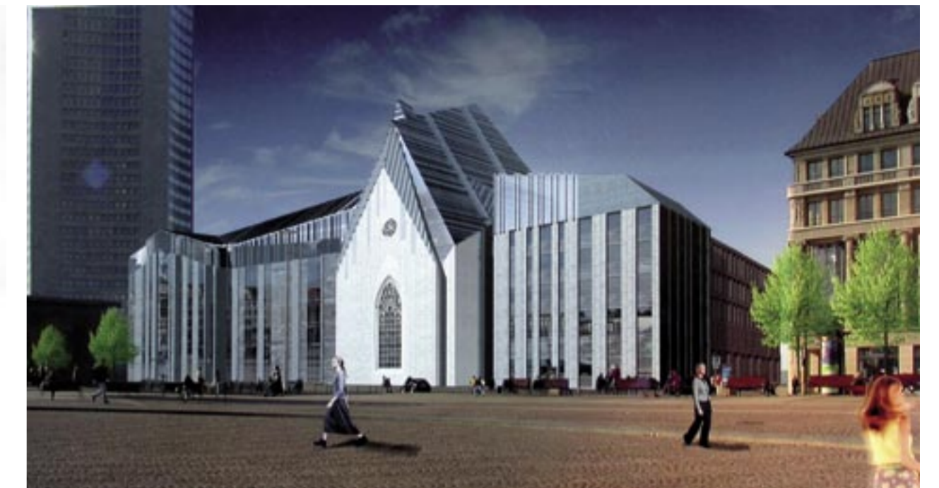
Siegerentwurf vom Architekturbüro Erick van Egeraat. Grafik: EEA - Erick van Egeraat associated architects