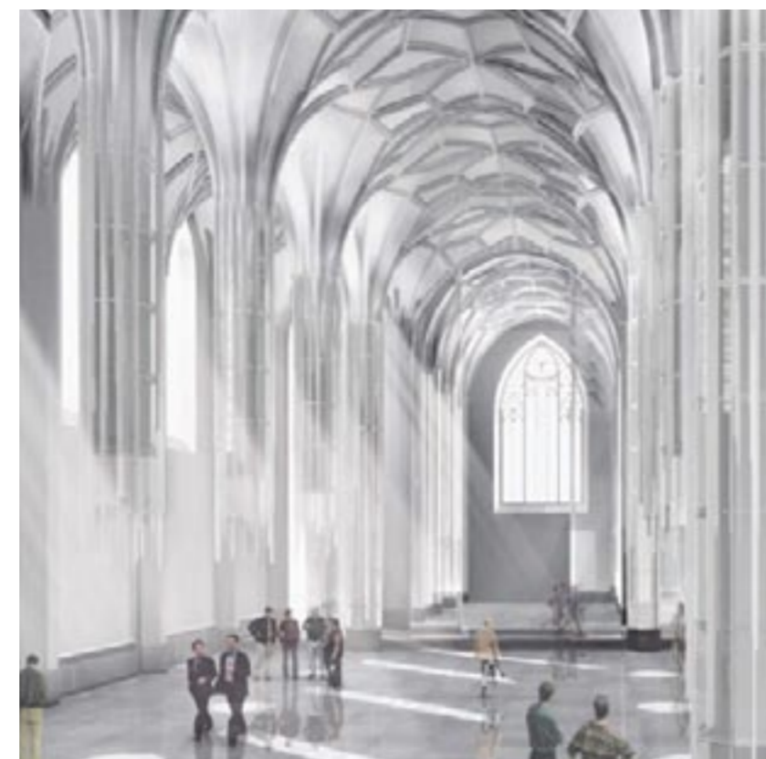
Innansicht Aula. Grafik: EEA - Erick van Egeraat associated architects