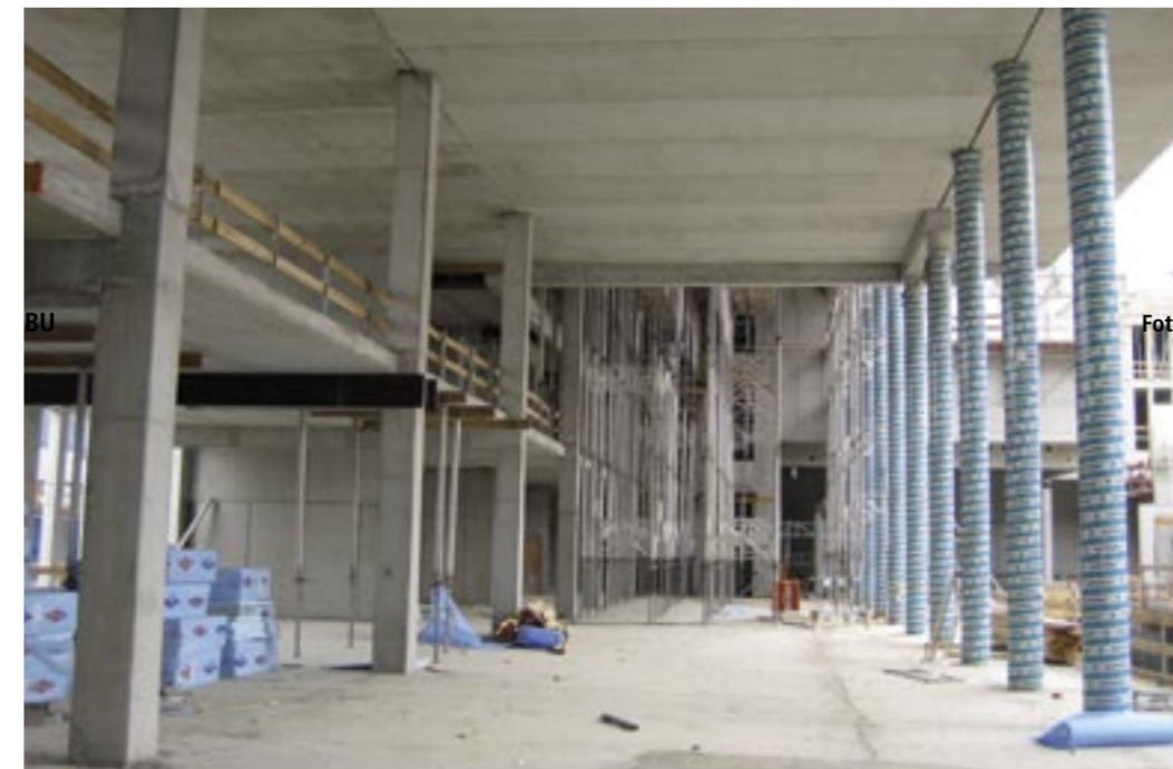
Stand Rohbauarbeiten Foyer Hauptgebäude.