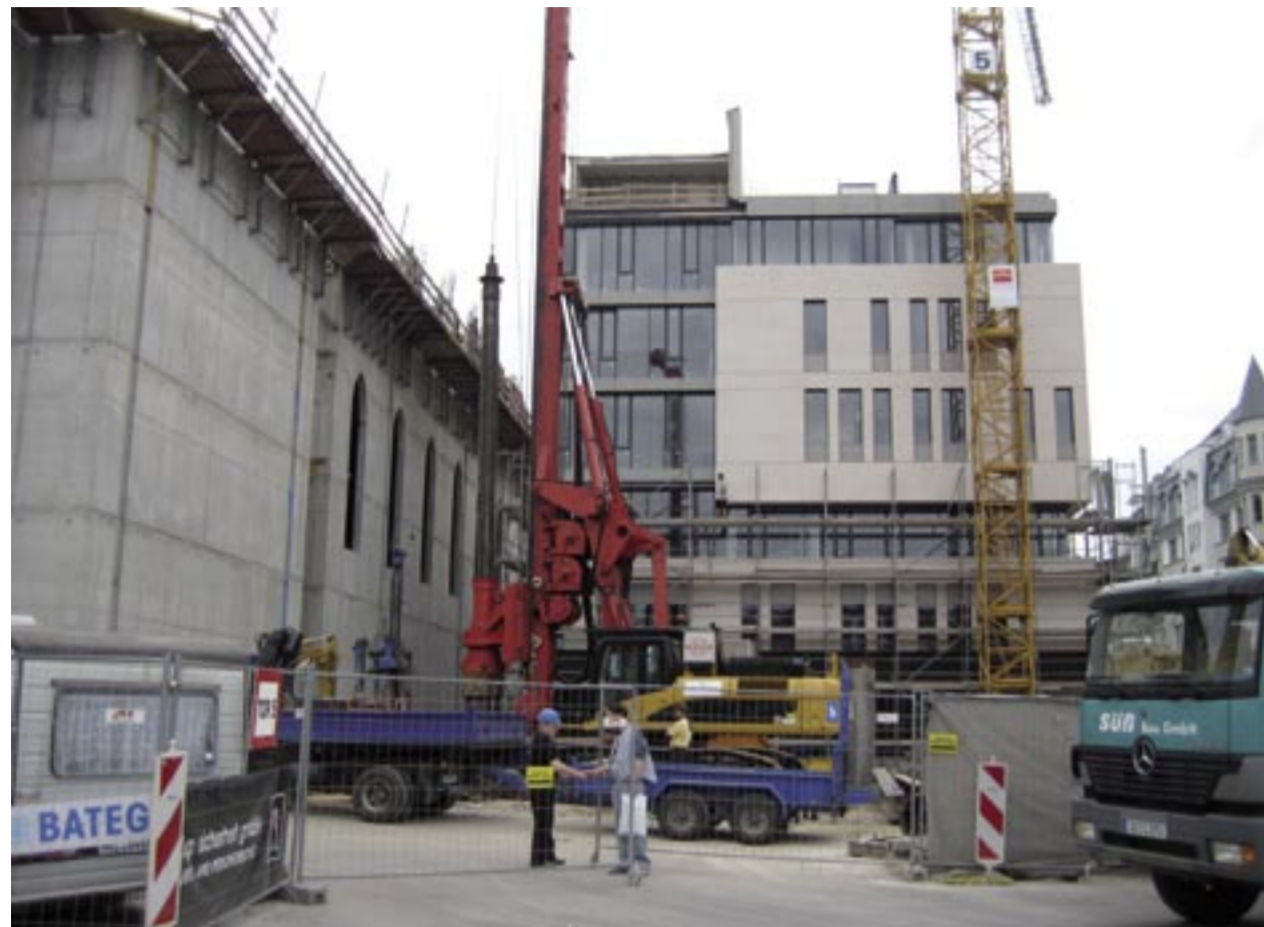
Neubau Institutsgebäude Wirtschaftswissenschaften von Osten/Augustusplatz.

LEIPZIG (MA). Nach langer Diskussion und zwei Ausschreibungen steht fest, wie sich die Universität Leipzig im Jahr 2009 präsentieren wird. Im Vordergrund des neu zu bauenden Campus Augustusplatz stehen die Ideen, die Zielsetzung und die Aufgaben einer Universität im 21. Jahrhundert: wissenschaftliche Forschung, akademische Lehre und die Wahrnehmung einer gesellschaftspolitischen Verantwortung. Gleichmaßen sinnbildlich wie gegenständlich steht dafür die neue Aula als multifunktionaler und repräsentativer Saal. Im Jubiläumsjahr 2009 soll der neue Universitätskomplex in den Grundzügen fertig gestellt sein.