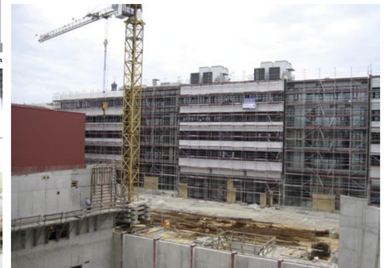
Fassade Sanierung Seminargebäude von Osten/Innenhof.

Die dort arbeitenden Firmen konnten eine Lösung finden und die Probleme am Hörsaal beheben. Aber die Erhaltung des alten Baus bringt nun nicht die erhoffte Einsparung an Baukosten von 27 Prozent, sondern kostet fast so viel wie ein Neubau. Vorteil ist aber, dass man nicht an die alten Fundamente ran musste. Alles in allem waren es rund neun Millionen Euro, die mehr investiert werden müssen. Die Mehrwertsteuererhöhung der aktuellen Regierung schlägt noch einmal etwa 350 000 Euro zu Buche. Weitere 11,5 Millionen Euro werden allein durch die Kostensteigerungen bei den Baupreisen seit der ersten Kalkulation fällig.