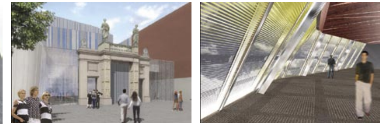
Schinkeltor. Grafik: EEA - Erick van Egeraat associated architects Innenmodell. Grafik: EEA - Erick van Egeraat associated architects

für Hauptgebäude, Mensa und Seminargebäude Haus IV. Die Zahl der in den einzelnen Bauabschnitten tätigen Firmen nimmt ständig zu, wie sich auch an den Eintragungen auf den Bauschildern ablesen lässt. Nach dem verlorenen Jahr im ersten und zweiten Bauabschnitt wird es jetzt eng mit den Terminen. Die Abschnitte drei an der Grimmaischen Straße und fünf an der Universitätsstraße liegen im Plan. Die Abschnitte eins und zwei, Mensa und Hörsaal, sowie drei und fünf (Seminargebäude), sollen im Dezember technisch fertig gestellt sein. Im März 2009 rechnen die Verantwortlichen mit der Übergabe dieser Baukomplexe, die dann ab dem Sommersemester 2009 nutzbar sein sollen. Bleibt noch der markanteste Bauabschnitt: Nummer fünf mit dem Großen Hörsaal im Neuen Augusteum und dem Kirchenraum plus Aula im Paulinum. Dort sind schon die Säulen zu sehen sowie die ersten Fenster mit gotischen Bögen. Noch ist die Front zum Augustusplatz völlig offen, während