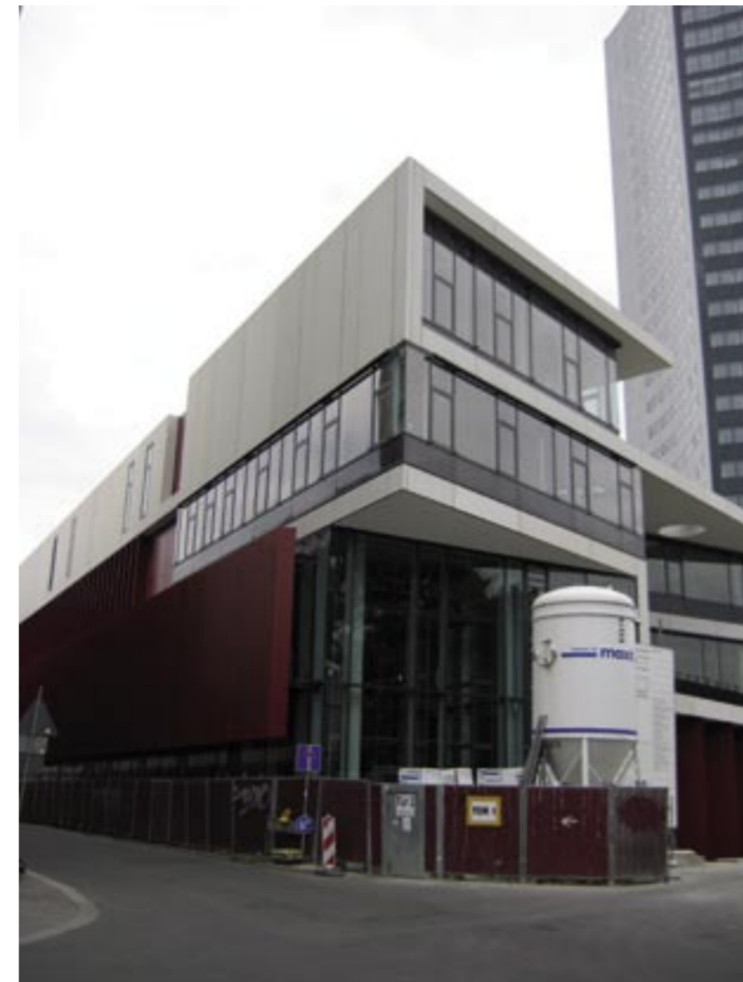
Fassade Neubau Mensa von Süden.

rung“. Bauherr ist der Freistaat Sachsen. Die Durchführung obliegt damit dem Staatsbetrieb Sächsisches Immobilien- und Baumanagement SIB. Dort wurde eine Sonderbauleitung eingerichtet, die sämtliche Beteiligten führt und koordiniert. Aus organisatorischen Gründen wurde das Gesamtvorhaben in mehrere Bauabschnitte unterteilt. Die Arbeiten begannen mit der Grundsteinlegung im zweiten Bauabschnitt am 18. Juli 2005. Zuvor war ein Generalunternehmer mit allen Leistungen zu diesem und zum ersten Bauabschnitt beauftragt worden. Der Bauablauf wurde im März 2007 angehalten und neu organisiert, nachdem dieser Bauvertrag vom Freistaat gekündigt wurde. Nunmehr bemüht sich der Staatsbetrieb Sächsisches Immobilien- und Baumanagement, die Fertigstellung durch gezielte Maßnahmen zu beschleunigen. Mit dem Ende des Wintersemesters 2006/2007 wurde der universitäre Betrieb am Standort eingestellt. Seit Mai 2006 waren alle sich noch im Haupt- und Seminargebäude befindlichen Nutzer und Funktionen in Interimbauten ausgelagert worden. Gleichzeitig setzte das Studentenwerk die alte Mensa außer Betrieb. Infolge der Verzögerungen beim Neubau mussten auch hier Lösungen für den Übergang gefunden werden. Im Februar 2007 begannen die Abbrucharbeiten