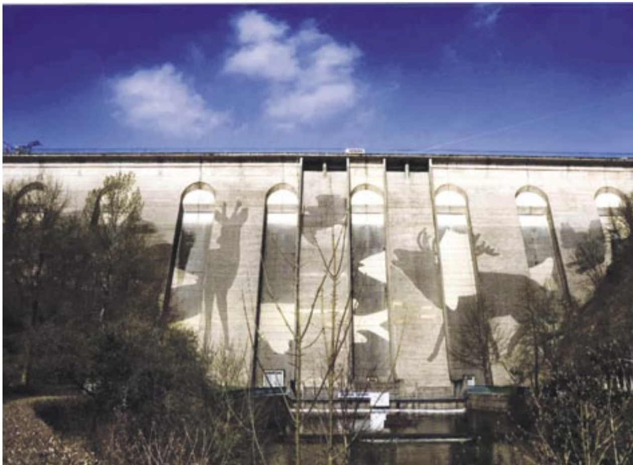
Im Kontrast von bearbeiteter zu unbearbeiteter Fläche sind heimische Waldtiere und Vögel in positiver, Fische in negativer Zeichnung an der Olefalsperre sichtbar.

Klaus Dauven, der vor allem im öffentlichen Raum arbeitet, setzt seit 2003 Hochdruckreiniger ein, um unter anderem auf Gartenmauern, in Unterführungen und auf Brückenpfeilern temporäre Zeichnungen zu erstellen. Er setzt sich dabei mit der Umgebung, die ihm als Untergrund dient, intensiv auseinander und bezieht sie in das Kunstwerk ein, ohne sie dabei – wie bei gewöhnlicher Graffiti – dauerhaft zu verändern.