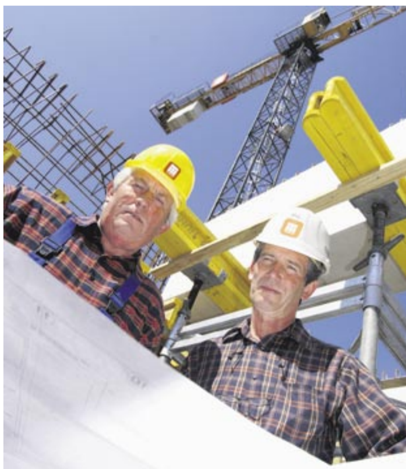
Wer auf der Baustelle improvisieren muss, weil nicht genügend Maschinen bereit stehen, der tut sich schwer.

Bei der Materialbeschaffung schlagen die Logistikkosten oftmals stärker zu