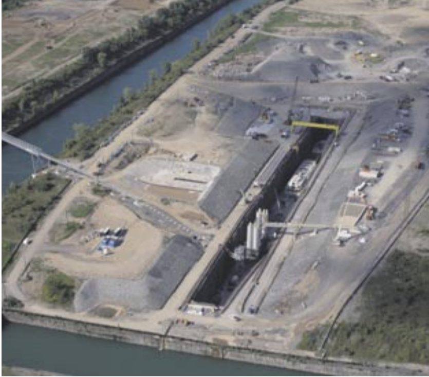
Strabag baut im Auftrag der Provinz Ontario einen 10,4 Kilometer langen Stollen.

ONTARIO, KANADA. Das Sir Adam Beck Kraftwerk an den Niagarafällen soll seine Kapazitäten erhöhen. Dazu müssen zusätzlich 500 Kubikmeter Wasser je Sekunde aus dem Niagara River über einen neu zu errichtenden Stollen zum vorhandenen Krafthaus geleitet werden. Die Planung des Tunnels verantwortet die Firma ILF Beratende Ingenieure aus Rum bei Innsbruck (Österreich), die ihre Tunnelplanungen inzwischen mit Civil 3D realisiert.