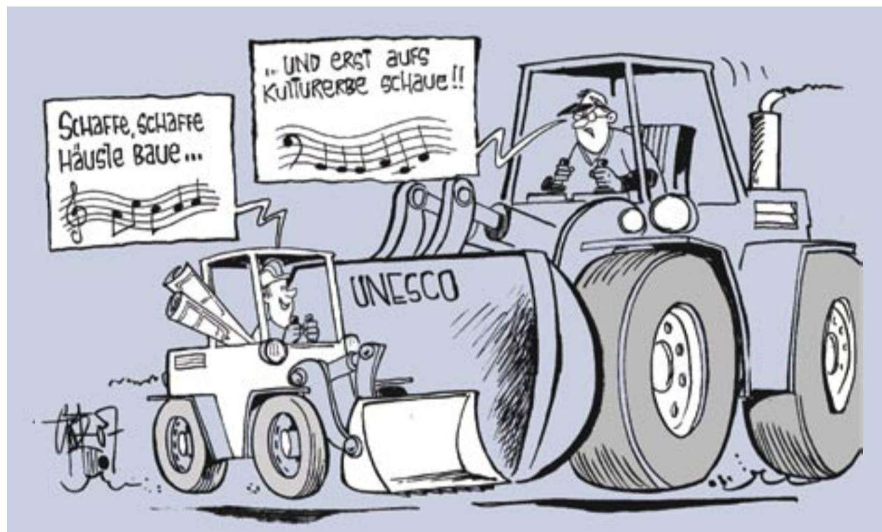
David gegen Goliath.

Auf der Welterbeliste der UNESCO sind 32 Stätten in Deutschland verzeichnet, die unter dem Schutz der Internationalen Konvention für das Kultur- und Naturerbe der Menschheit stehen. Mit der 1972 von der UNESCO verabschiedeten Konvention sollen Kultur- und Naturstätten, die einen „außergewöhnlichen universellen Wert“ besitzen, bewahrt werden. Um in die Liste des Welterbes aufgenommen zu werden, müssen Denkmäler die in der Konvention festgelegten Kriterien, wie „Einzigartigkeit“ und „Authentizität“ (bei Kulturstätten) oder „Integrität“ (bei Naturstätten) erfüllen.