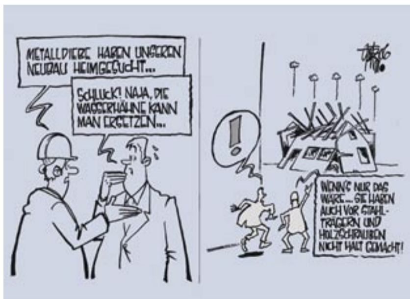
Rohstoff-Diebe auf Beutezug.

Schon seit längerem ist der Deutschen Bahn bekannt, dass Kupferleitungen an Oberleitungsmasten, die zur Erdung nötig sind, entwendet werden.