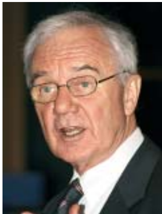
Manfred Stolpe

Dr. Manfred Stolpe, Bundesminister für Verkehr, Bau- und Wohnungswesen, auf dem Neujahrsempfang der Bundesvereinigung Mittelständischer Bauunternehmer (BVMB) in Bonn.