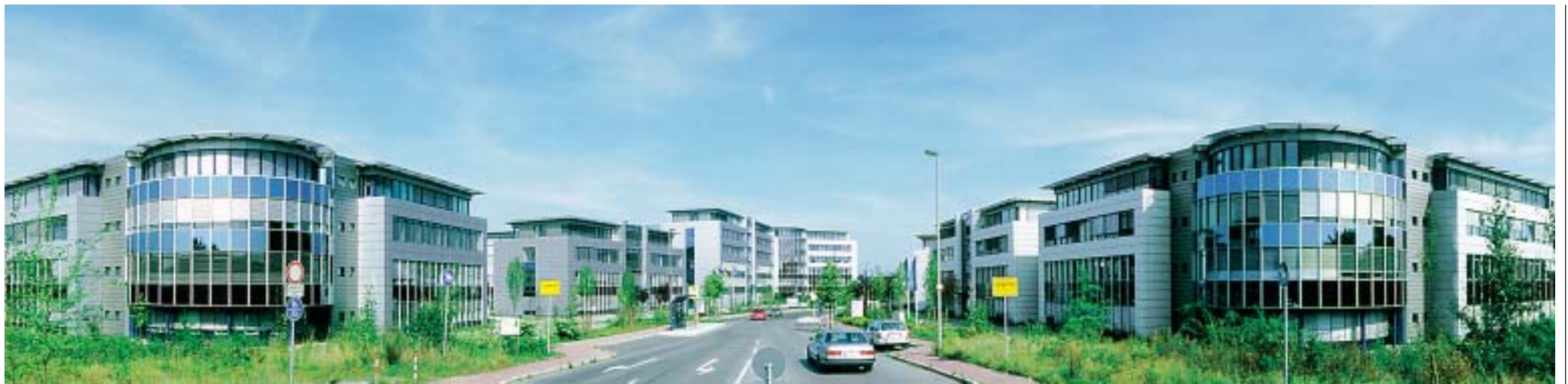
Business-Park Langenfeld: Das Blau des Himmels, das sich bei schönem Wetter in den Fenstern spiegelt, und das blanke Metall in den Vertikalen bestimmen das Erscheinungsbild.