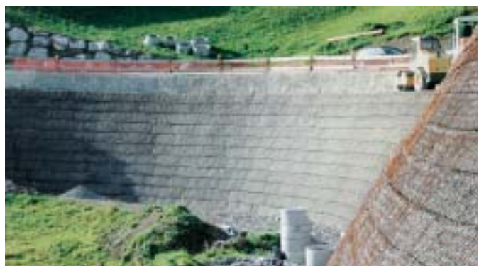
Bot bei der Beseitigung eines Engpasses auf der L 193 im Vorarlberg die wirtschaftlichste Lösung: die flexible und anpassungsfähige KBE-Bauweise. Mit ihr sind engste Radien wie auch Böschungswinkel bis zu 90° möglich.

Während der Bauarbeiten wurde der Verkehr einspurig aufrecht erhalten. Vor dem Einbau der Dammschüttung stellten die Straßenbauer eine Nagelwand her und verlegten – zur schadlosen Ableitung von lokal auftretenden Hangwässern – vollflächig auf der mit Entspannungsbohrungen perforierten Spritzbetonhaut eine Drainagematte, um anfallendes Wasser zur Talseite abzuleiten. Im Schutz dieser provisorischen Sicherung erfolgte anschließend der Aufbau der Bewehrte-Erde-Konstruktion. Für die Bewehrung des Dammkörpers bauten die Arbeiter bis zu 15 Lagen Fortrac-Geogitter mit einer Längszugfestigkeit von 55 bis 110 kN/m ein. Der vertikale Abstand der einzelnen Geogitter betrug 0,6 m. Nach Abschluss der Bauarbeiten erfolgt die Begrünung durch Hydrosaat.