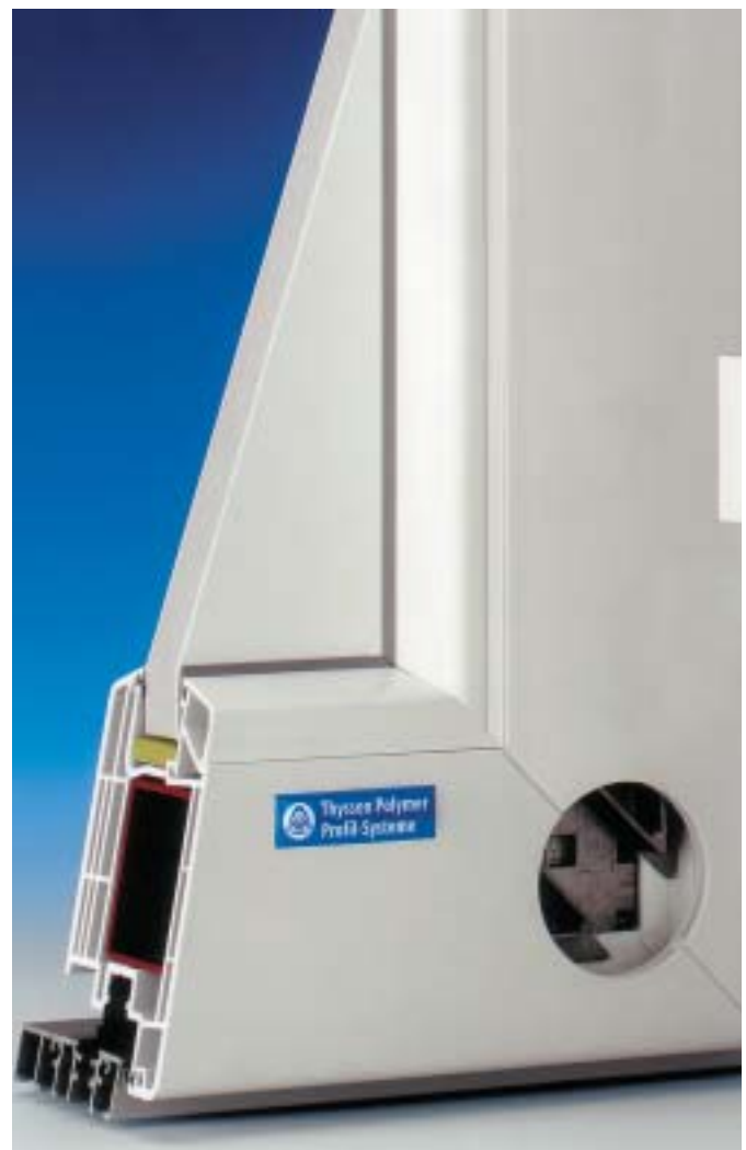
Erfüllt hohe Ansprüche in Optik und Ausführung: neue 5-Kammer-Haustür Prestige im Querschnitt.

tengerechtem Bauen. Großdimensionierte Aussteifungsstäbe mit 2 mm Wandungsstärke gewährleisten hohe Verwindungssteifigkeit. Als Füllungen lassen sich Glasscheiben oder Paneele bis 44 mm Dicke einsetzen. Die Profilkonturen sind mit 20° abgeschragten Anschlagkanten und kräftigen Radien ausgelegt, um den fertigen Türen eine abgerundete, gefällige und griffige Optik zu verleihen. Die verschleißsichere Gebrauchstauglichkeit ist geprüft auf 100 000 Lastwechsel.