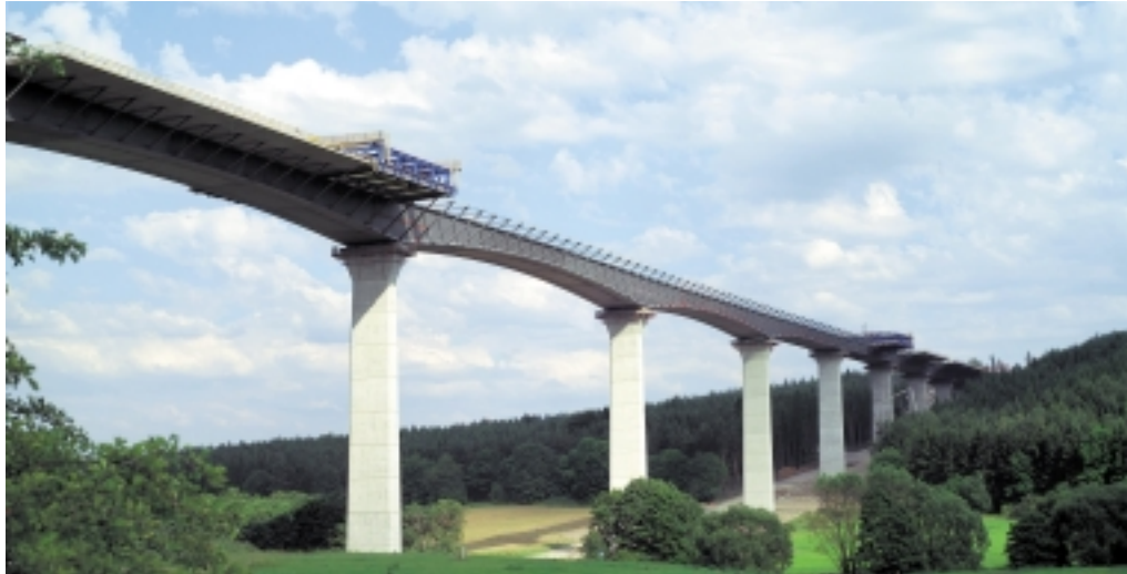
Die Betonfahrbahnplatte der Reichenbachbrücke in Thüringen wurde mit Doka-Verbundschalwagen im Pilgerschrittverfahren hergestellt. Bauausführung: Strabag Linz/München.

Neben seinen bewährten Systemen stellt Schalungsspezialist Doka, Maisach, auf der „Intermat 2003“ (13.–17. Mai) in Paris eine ganze Reihe von Innovationen erstmals dem französischen Fachpublikum vor. Mit all diesen Systemen lassen sich Betonbauwerke in nahezu jeder Form und Oberflächen-Qualität auf wirtschaftliche Weise erstellen.