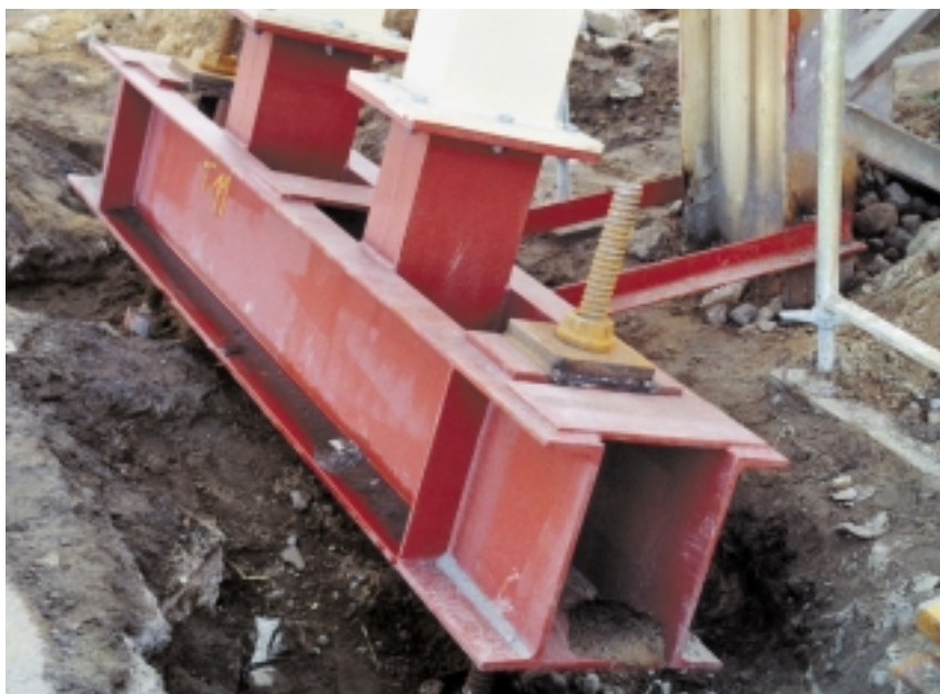
Die Stützkräfte der Diagonalstreben an den Kranbahnstützen bei EKO sind über Kraftübertragungsträger in jeweils zwei 15 000 mm tief eingebrachte und verpresste selbstbohrende „Titan 52/26“-Injektionspfähle geleitet.

Die selbstbohrenden Injektionsanker lassen sich mit allen markt gängigen Bohrmaschinen verarbeiten. Sie werden dazu mit verloren gehenden Bohrkronen bestückt, deren Formen und Schneideigenschaften exakt auf die jeweils anstehende Bodenart abgestimmt sind. Die technologische Einfachheit des Verarbeitens von selbstbohrenden Injektionsankern und -pfählen ermöglichte es Heitkamp, die Sanierungsarbeiten an der gesamten Schrottplatz-Kranbahn von EKO innerhalb von zwei Wochen auszuführen.