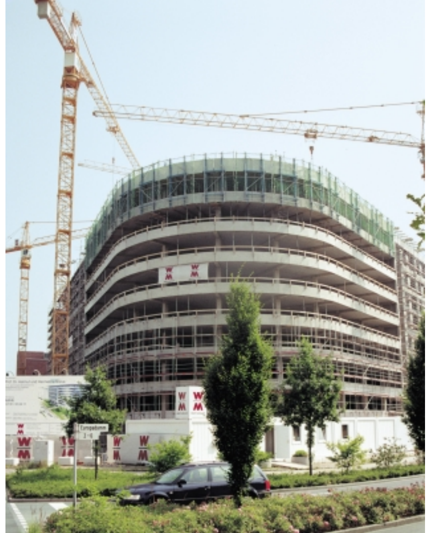
Die neue Doka-Fassadenschalung erlaubt einen zügigen Bauablauf. Die Ortbetonstützen an der Außenseite des Gebäudes werden gemeinsam mit den exakt eingerichteten Brüstungsfertigteilen vergossen. Bauvorhaben: Verwaltungszentrum in Neuss, Bauausführung: Wolff & Müller.

Erstmals auf dem französischen Markt präsentiert Doka das neue System der Fassadenschalung. Es besteht aus einer Stützenschalungseinheit und dem Traggerüst für die Brüstungsfertigteile. Auf der Baustelle stützt sich das Traggerüst an der unteren, schon fertig gestellten Brüstung ab und wird über Einrichtstützen und Justierspindeln eingerichtet. Die Fassadenschalung erlaubt einen zügigen Bauablauf und entlastet den Kran, der nur während kurzer Zeitspannen zum Einheben der Fertigteile gebraucht wird.