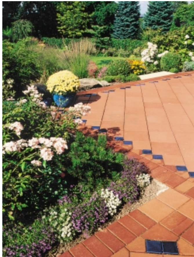
Die warme Ausstrahlung von Pflasterklinkern beruht auf dem natürlichen Material: reiner gebrannter Ton.

schnittlänge von 4 m und knapp 1 t Gewicht war ein gefährlicher Jäger. Nach Ende der Trias-Ära, als die ersten Dinosaurier auftauchten, verschwanden diese Arten.