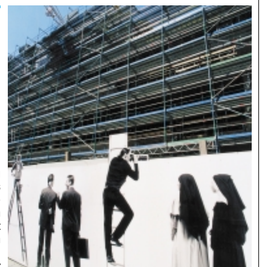
Macht neugierig auf das, was dahinter entsteht: Bauzaun in Nürnberg mit „Passanten“ in Lebensgröße.

Nürnberg) nach Planungen des Nürnberger Architektenbüros Niederwöhmeier + Kief für die Vierte ImmoCom Verwaltung GmbH & Co. ein Kaufhaus in attraktiver Citylage. Hauptmieter wird die Warenhauskette Breuninger aus Stuttgart sein. bu