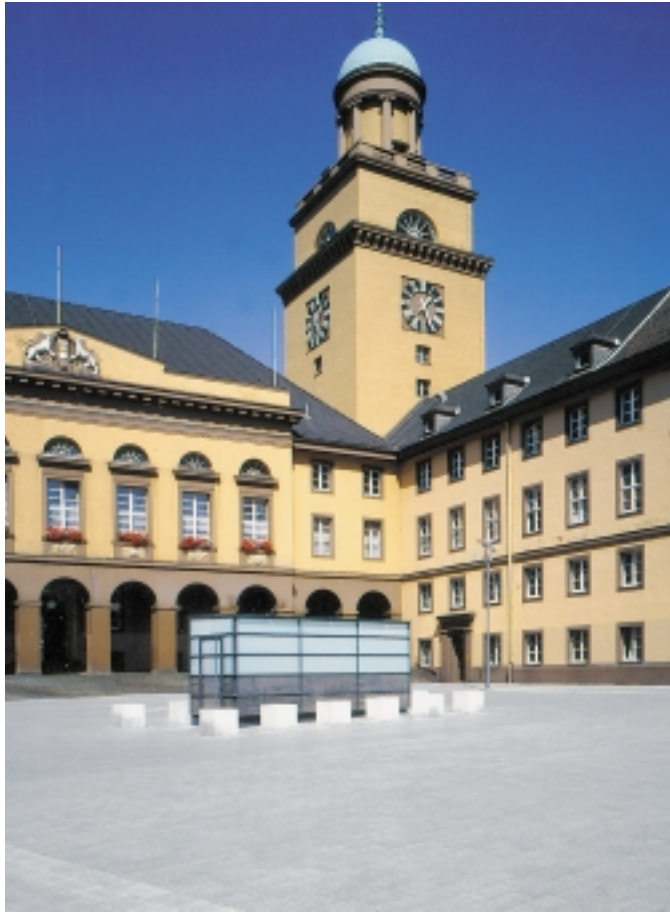
Lebt von der weiträumigen und einheitlichen Ausgestaltung: der neue Rathausplatz in Witten.

WITTEN AN DER RUHR: NEUER GLANZ FÜR DIE INNENSTADT