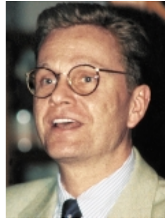
Dr. Guido Westerwelle